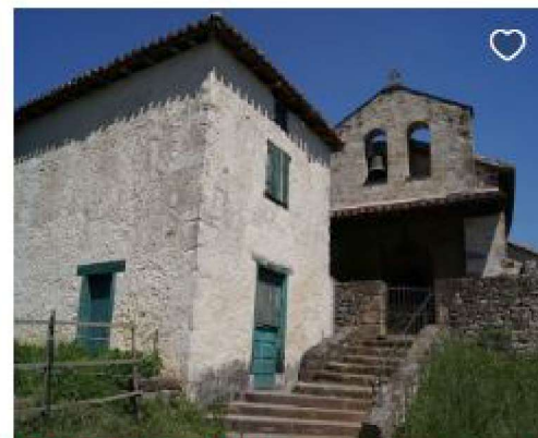
Rites et traditions religieuses en Pays Basque