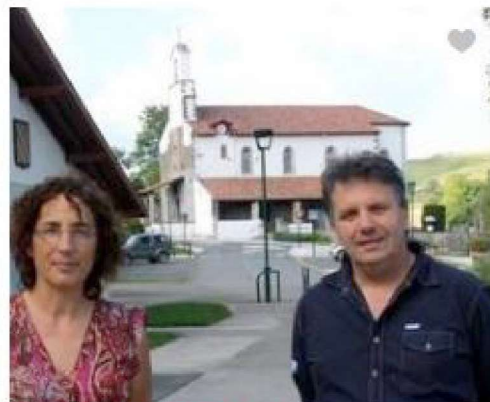
Balade racontée SAINT-MARTIN-D'ARBEROUE (64640)